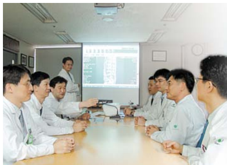
Консилиум врачей по лечению пациентов

Это традиция больницы Уридыль, сложившаяся на протяжении нескольких десятков лет, когда медицинский персонал всех больниц Уридыль, находящихся не только на территории Кореи, но и за пределами, каждую пятницу собирается для обмена опытом, обсуждения планов лечения пациентов и новых медицинских технологий. Все больницы сети Уридыль, а также и другие медицинские учреждения могут участвовать при проведении теле-конференции и проведении мастер-класса, тем самым повышая свою квалификацию.